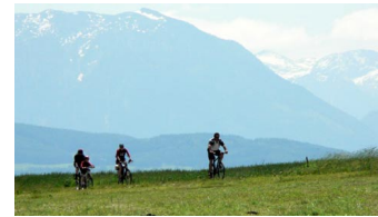
Radler am See (Blick Untersberg)

G enießen Sie die traumhafte Gegend zu Fuß oder mit dem Rad. Die abwechslungsreiche Landschaft bietet ausgezeichnete Voraussetzungen. Die Natur zeigt Ihnen hier gleich ein paar ihrer vielen Gesichter. Bewundern Sie die nahen Flüsse und Auen, das benachbarte Moor oder die traumhaften Bayerischen Berge.