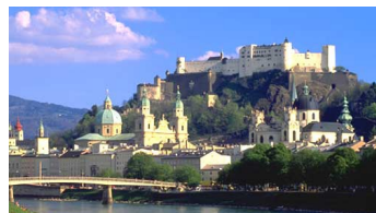
Salzburg (ca. 20km)