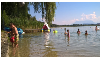
Fein gekiefter Seezugang

A m privaten Strandbad mit kleinem Kinderspielplatz haben Sie immer Zugang zum wärmsten See Bayerns. Ein lokaler Bäcker verwöhnt Sie täglich mit frischen Backwaren. Für genügend gekühlte Getränke ist bei uns immer gesorgt. Und sollte Sie der große Appetit einmal überraschen, sind es zum nächsten Gasthaus ca. 200m.